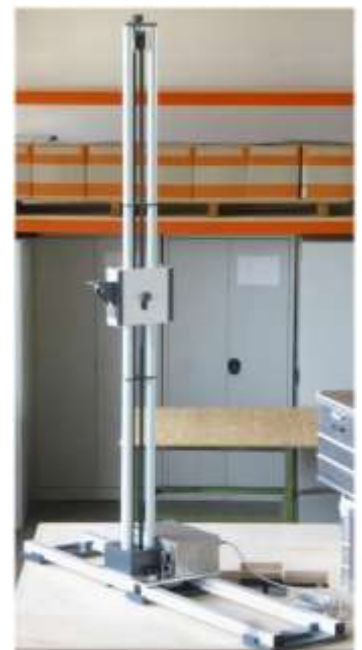
fig. 1: Field Probe Positioner FSM2315 in the 2014 version

The IEEE 488 (GPIB) bus, when operated with the CO 2000 Controller, or IEEE 488 (GPIB) & TCP/IP (LAN) interface, when operated by CO 3000 Controller provides an additional control option for all functions.